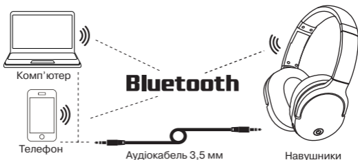
Мал. 2. Схема підключення