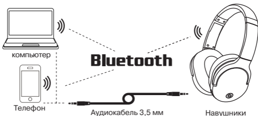
Рис. 2. Схема подключения