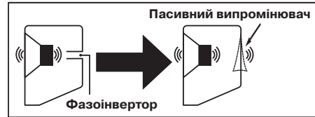
Мал. 2. Принцип дії пасивного випромінювача

АС S-70 оснащена пасивним випромінювачем ①. Основна його перевага у відтворенні низьких частот з мінімальним спотворенням і з вищим рівнем звукового тиску, порівняно з використанням звичайних фазоінверторів (див. мал. 2).