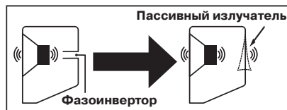
Рис. 2. Принцип действия пассивного излучателя

В AC S-60 применена конструкция с пассивным излучателем ①. Основное преимущество пассивного излучателя – его способность воспроизводить низкие частоты с минимальными искажениями и с высшим уровнем звукового давления, чем при применении обычных фазоинверторов (см. рис. 2).